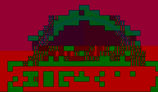
AA6-160A-D-AM Screw Compressors